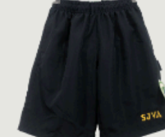
Short deportivo hombre, con malla interior