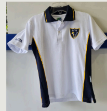
Polera Piqué Unisex manga corta