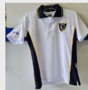
Polera Piqué Unisex manga corta