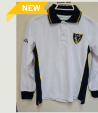
Polera Piqué Unisex manga larga