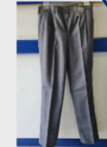
Pantalón hombre color gris, con pinza

Únicamente estudiantes de IV° Medio usan blusa (en vez de polera de piqué) junto a su corbata y piocha , tal como establece el RIE .