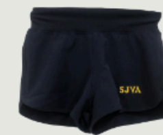
Short deportivo niña, con calza incorporada.