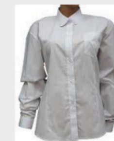
Blusa/camisa escolar blanca SÓLO para IV° Medio.