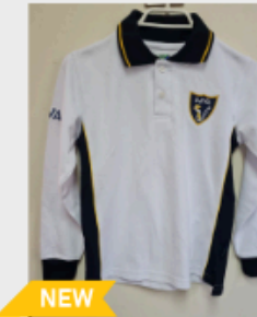
NEW Polera Piqué Unisex manga larga