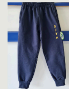
Buzo Unisex con puño

Solo se permitirá el uso de prendas pertenecientes al uniforme escolar SJVA .