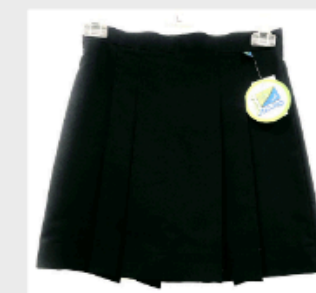
Falda mujer, azul marino, cuatro tablas.