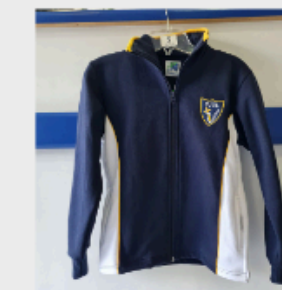
Polerón Unisex (usado también para uniforme de Ed. Física)